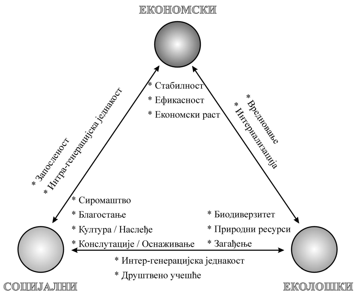
Слика бр. Три главна стуба одрживог развоја

Како би циљеви концепта одрживог развоја били у потпуности остварени, неопходна је међусобна повезаност и комплементарност све три његове димензије (слика бр. 1). Посебно је важно да се свакој димензији развоја придаје подједнак значај. Ово је у пракси веома тешко остварити јер се обично некој димензији одрживог развоја придаје већи значај. Као најзначајније димензије се најчешће издвајају еколошка или економска.